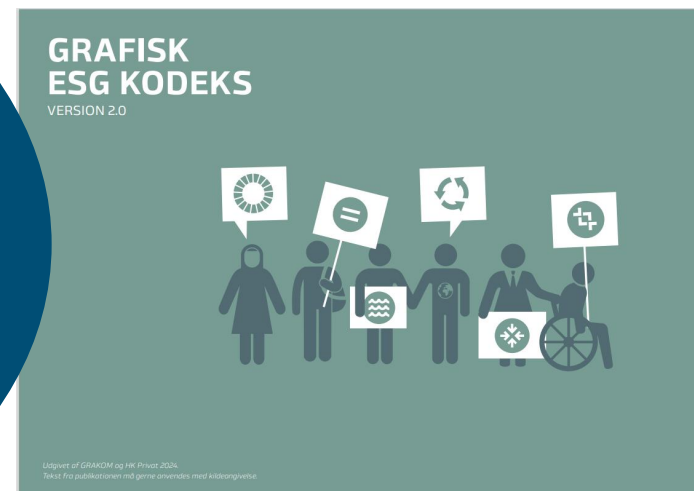
Grafisk ESG-kodeks – rammeværk med de væsentligste ESG-påvirkninger/risici