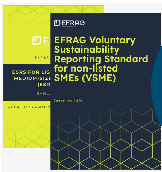
EU's frivillige standard for SMV'ers ESG-rapportering (generisk og simpel)

Med udgangspunkt i EU's frivillige standard for SMV'ers ESG-rapportering og det grafiske ESG-kodeks, er GRAKOM ved at udvikle en ESG-rapporteringsskabelon (i Q2/Q3 2025). Den vil understøtte simpel, relevant og værdibaseret ESG-rapportering.