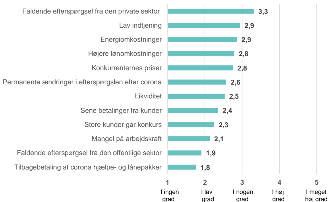
Figur 4: Service- og handelsvirksomheder: "I hvilken grad bekymrer du dig om nedenstående faktorer for din virksomhed det kommende år?"

Note: Besvarelser fra 52 service- og handelsvirksomheder