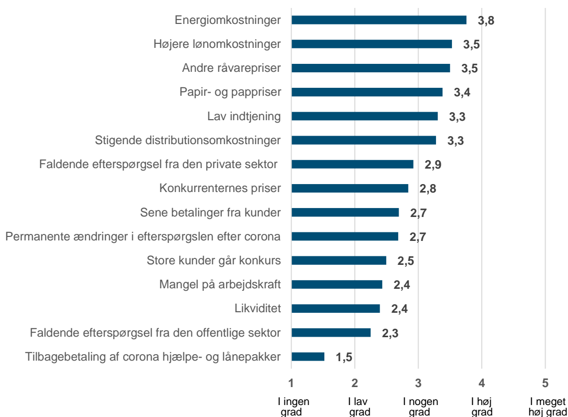
Figur 3: Spørgsmål til produktionsvirksomheder: "I hvilken grad bekymrer du dig om nedenstående faktorer for din virksomhed det kommende år?"

Note: Besvarelser fra 88 virksomheder med fysisk produktion