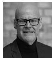
Steen Rocatis Bording Danmark A/S