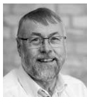
Allan Werk WERKS Grafiske Hus a/s