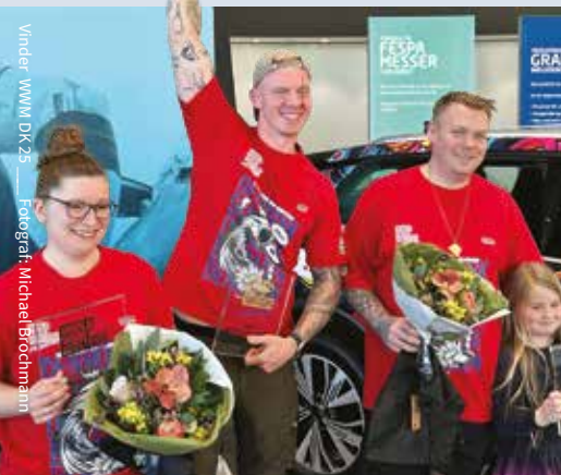
Vinder: WWW DK 25