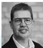
Niels Rask NS System A/S