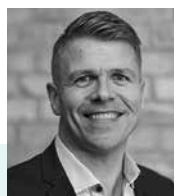
Palle Studsgaard Odgaard Dystan & Rosenberg ApS